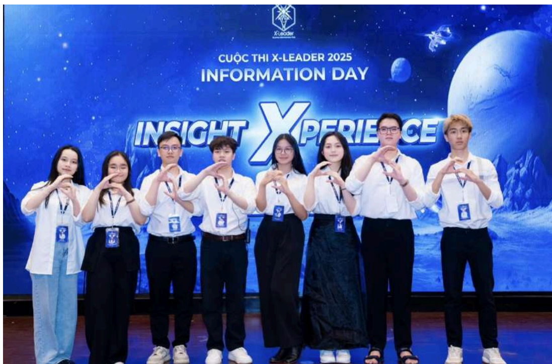
Hình 3 và 4: Ban Tài chính (Finance)