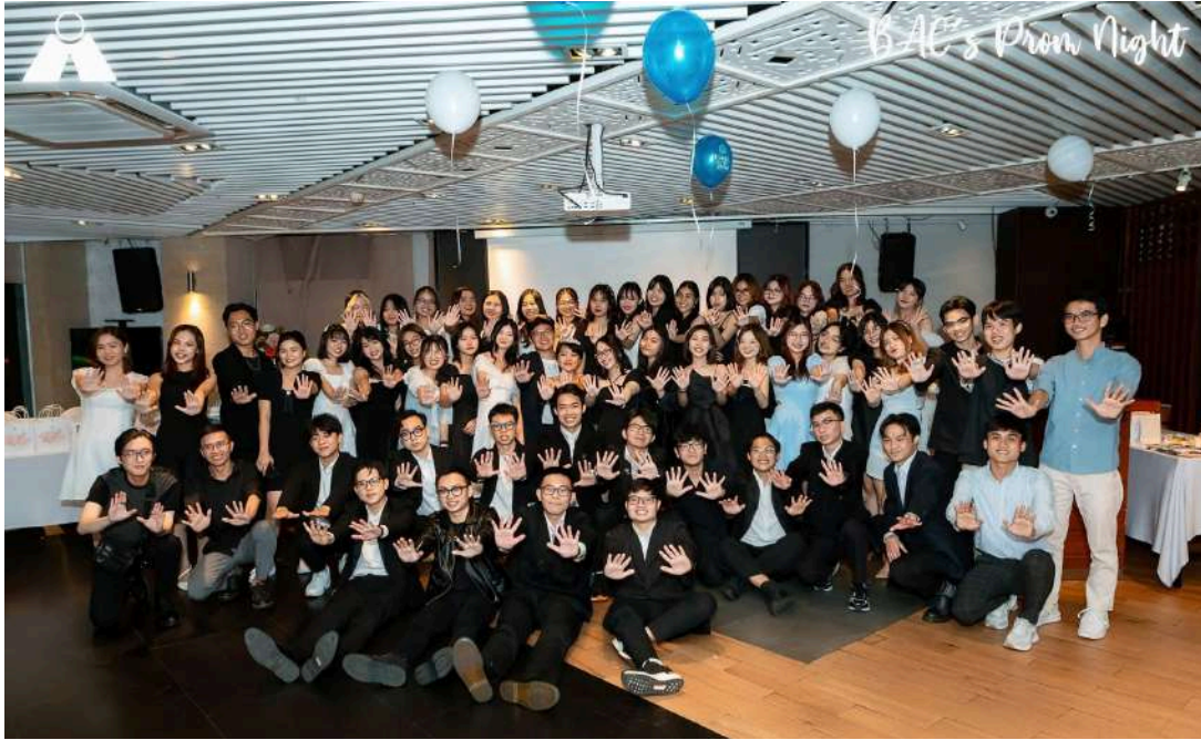
Hình 20: BAC's Prom Night