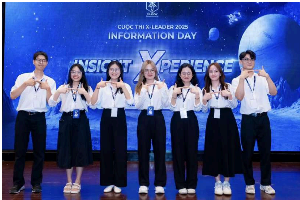
Hình 6: Ban Nhân sự (Human Resources)

chỉ là nơi hỗ trợ, quản lý mà còn là ngôi nhà thứ hai, nơi mỗi thành viên được lắng nghe, được tôn trọng và trưởng thành trong một môi trường đầy yêu thương và tin cậy.