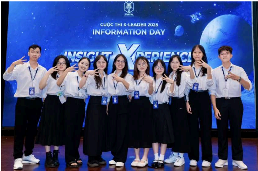
Hình 2: Ban Sự kiện (Event)

Là nơi hội tụ của những cá nhân năng động, nhiệt huyết và đầy ắp ý tưởng táo bạo, Ban Sự kiện đóng vai trò như một “bộ máy sáng tạo” không thể thiếu trong mọi hoạt động của CLB. Với sứ mệnh là nền móng cho sự thành công của các chương trình, Ban không chỉ chịu trách nhiệm lên ý tưởng, xây dựng nội dung và định hình chủ đề cho từng sự kiện mà còn là cầu nối quan trọng trong việc liên hệ, kết nối với các diễn giả, MC, khách mời và những người có sức ảnh hưởng trong nhiều lĩnh vực. Mỗi thành viên của Ban đều mang trong mình tinh thần sáng tạo không ngừng, luôn sẵn sàng đổi mới để tạo nên những chương trình độc đáo, chấn chu và mang đậm dấu ấn riêng của BAC .