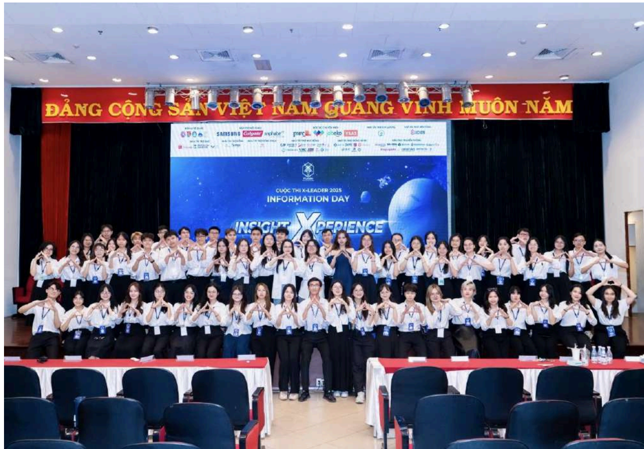
Hình 1: Đại gia đình BAC cùng chạy sự kiện