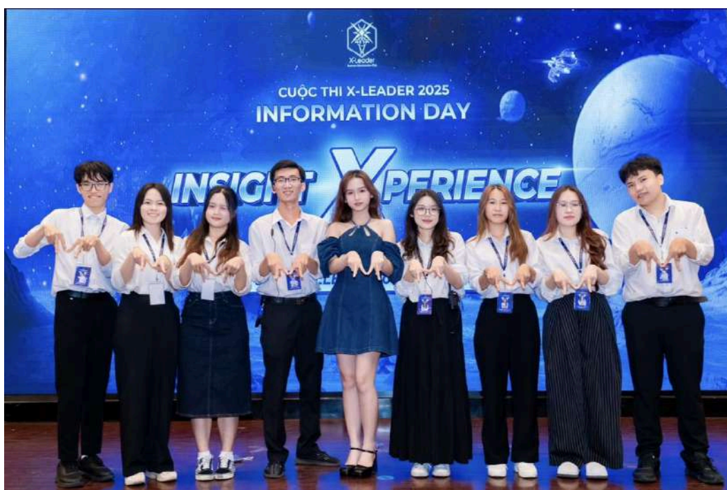
Hình 5: Ban Truyền thông (Marketing)

Là bộ phận nòng cốt trong việc xây dựng và phát triển hình ảnh của CLB, Ban Marketing đóng vai trò quan trọng trong việc định hình thương hiệu BAC trong mắt cộng đồng sinh viên. Ban đảm nhiệm việc truyền tải thông điệp, lan tỏa giá trị cốt lõi của CLB thông qua các bài viết, thiết kế và chiến dịch truyền thông trên Fanpage, trang nội bộ và các nền tảng khác. Không chỉ dừng lại ở việc quảng bá sự kiện, Ban còn chú trọng mang đến những kiến thức bổ ích về quản trị kinh doanh, kỹ năng lãnh đạo và phát triển cá nhân thông qua các bài đăng chuyên đề học thuật. Bằng sự nhạy bén, tinh thần sáng tạo và khả năng kết nối, Ban chính là cầu nối giữa BAC và cộng đồng, góp phần lan tỏa hình ảnh một tổ chức chuyên nghiệp và truyền cảm hứng đến các bạn sinh viên.