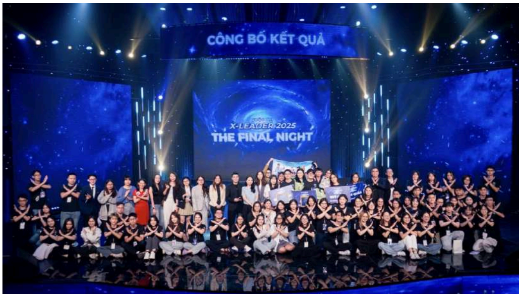
Hình 12: Đêm chung kết của Cuộc thi X-Leader 2025