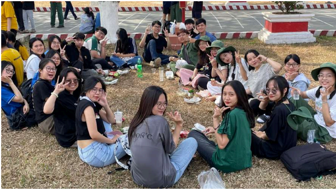
Hình 15: Chuyển đi thăm và chơi trò chơi với các thành viên tại khu quân sự