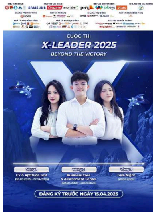
Hình 11: Poster cuộc thi X-Leader 2025