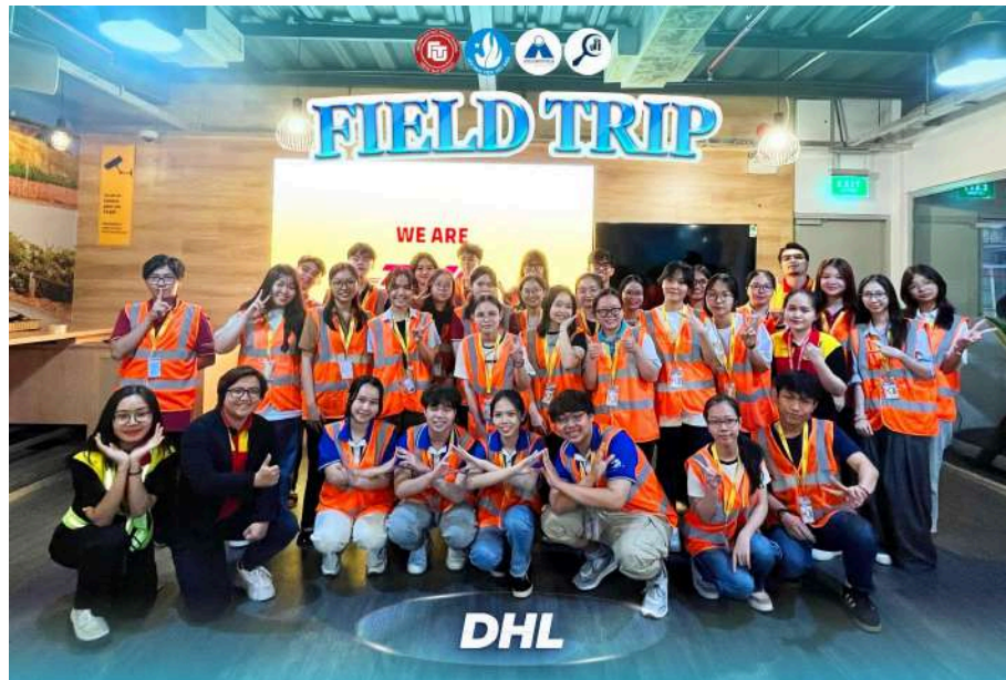
Hình 10: Chương trình Field Trip 2024