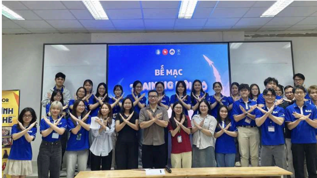
Hình 13: Buổi training nội bộ về Market Research

đa dạng các lĩnh vực từ Business Case đến kỹ năng tạo ấn tượng với nhà tuyển dụng. Chuỗi hoạt động Training này sẽ giúp các thành viên tích lũy được nhiều kiến thức và kỹ năng cần thiết, không chỉ cho quá trình hoạt động trong CLB mà còn cho việc định hướng nghề nghiệp trong tương lai.