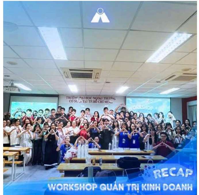
Hình 7 và 8: Workshop Quản trị kinh doanh